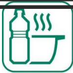
HUILES DE FRITURES

AR Préfecture 083-248300394-20240930-DEL_BC_2024_29-DE Reçu le 08/10/2024